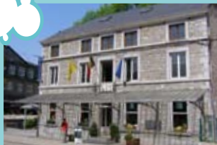
Maison du Tourisme du Pays d'Ourthe-Ambiève

INFO : 080 78 58 05 (du lundi au jeudi de 19h à 20h)