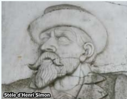
Stèle d'Henri Simon

Du 5 septembre au 25 octobre 2009, s'est tenue au Grand Curtius à Liège une exposition consacrée au grand architecte de l'Art Nouveau Paul JASPAR. Sa première réalis-